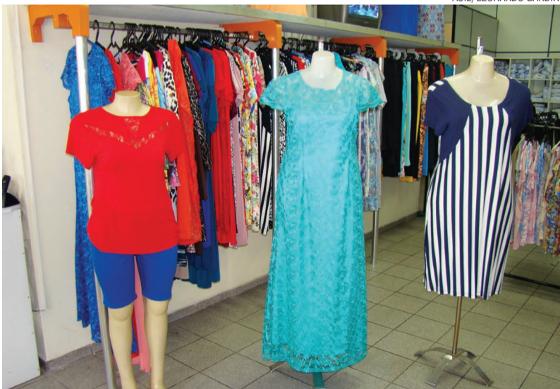
A moda Plus Size traz uma iminente oportunidade para o empreendedor que deseja apostar em um novo segmento

Segundo dados recentes do Instituto Brasileiro de Geografia e