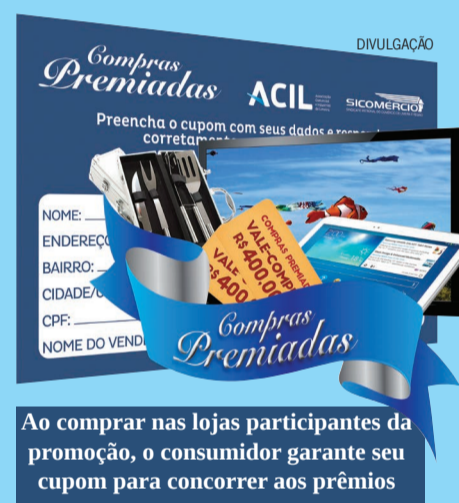
Ao comprar nas lojas participantes da promoção, o consumidor garante seu cupom para concorrer aos prêmios

O presidente também ressalta a importância de preencher corretamente aos cupons da promoção Compras Premiadas. “Os clientes devem informar todos os dados solicitados, como nome completo, endereço, telefone e número de algum documento oficial (RG ou CPF). Na falta de algum desses dados, o cupom será desclassificado. Então, é muito importante preencher os dados com atenção”, completa Gazzetta.