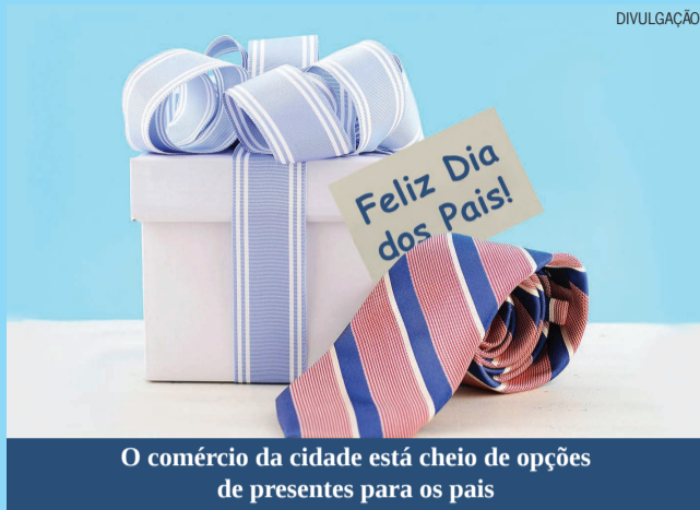
O comércio da cidade está cheio de opções de presentes para os pais